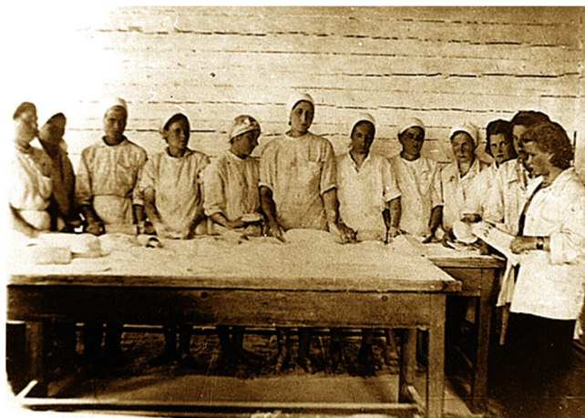
Работницы Горпищекомбината слушают сводку Совинформбюро. 1943 год