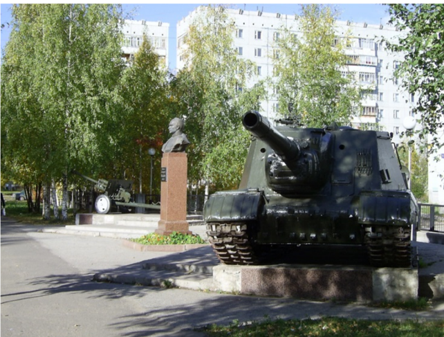
Мемориал В.А. Малышеву в Сыктывкаре

После капитуляции Японии 2 сентября 1945 года наконец-то наступило мирное время – но оно существенно отличалось от довоенного периода. Великая Отечественная война внесла в жизнь Сыктывкара и горожан серьезные перемены. Существенно изменился национальный и социокультурный состав населения города, размывались прежние городские обычаи и традиции. Провинциальная и неспешная, в чем-то провинциальная, жизнь Сыктывкара 1920–1930-х годов уступала место более современным социальным явлениям и формировавшимся новым городским отношениям.