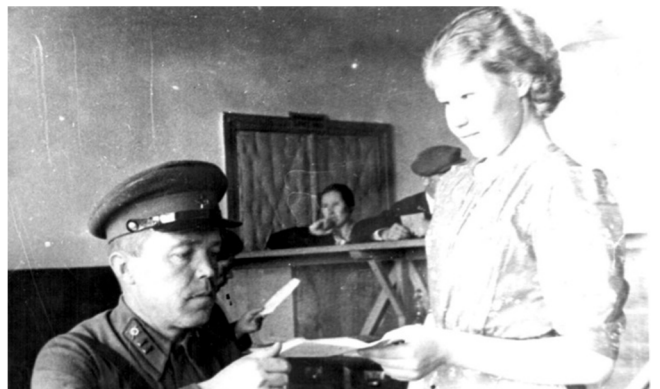
В Сыктывкарском военкомате