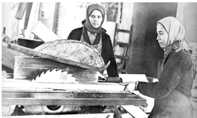
Работницы цеха по изготовлению лыж для армии. Октябрь 1941 года

Начали выпускать, пусть и в небольшом количестве, трикотаж, чулки, носки, пуговицы, детские игрушки, скобяные товары. Полукустарным способом пытались изготавливать хозяйственное мыло, спички, обувь на деревянной подошве и др. В 1942 году была открыта мастерская по производству керамической посуды и другой домашней утвари при кирпичном заводе. В 1943 году был организован птицекомбинат, выпускавший макаронные и кондитерские изделия, продукты переработки огородных культур, лесных ягод, грибов, заменитель кофе, конфеты, пряники. Начал работать кожевенно-обувной комбинат, часть продукции которого предназначалась для фронта. Началось строительство молочного завода и колбасно-холодильного цеха на мясокомбинате.