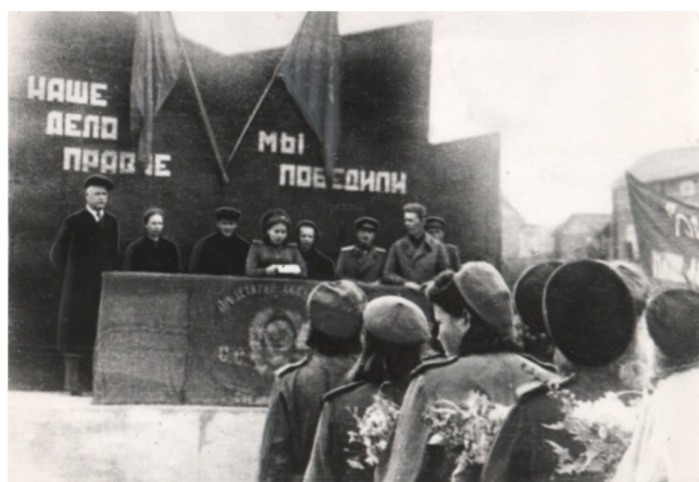
Митинг в Сыктывкаре по случаю возвращения фронтовиков. 1945 г.