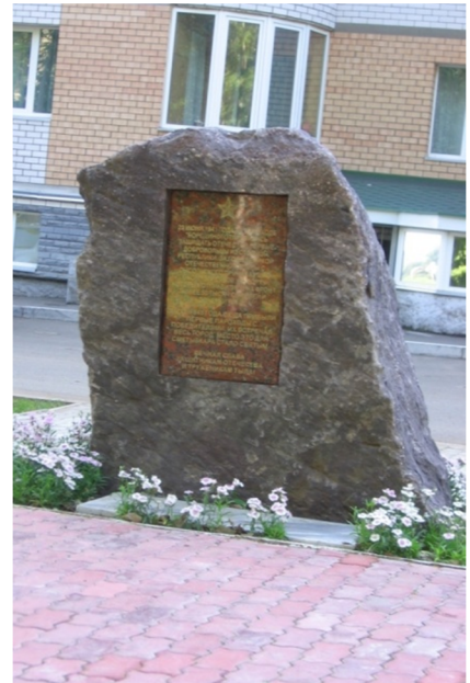
Памятный знак в честь сыктывкарцев – добровольцев, ушедших на фронт в годы Великой Отечественной войны