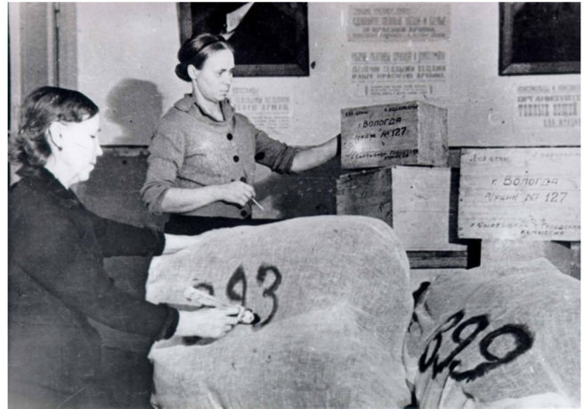
Отправка посылок в Действующую армию

Уже в 1942 году начался сбор средств и предметов первой необходимости в фонд помощи освобожденным районам СССР. Только учащиеся и учителя школ Сыктывкара к марту 1943 года внесли в этот фонд 67 700 рублей (облигациями и наличными деньгами), 1200 предметов одежды, около 200 тетрадей, 100 ручек и 300 томов художественной литературы. Трудящимся освобождённых районов Тульской области сыктывкарцы собрали и отправили 10523 штуки одежды, 712 пар обуви, 594 метра мануфактуры, 280 штук посуды, 17 464 учебных пособий и 8 вагонов пиломатериалов. Для восстановления животноводческих ферм районов Новгородской и Ленинградской областей колхозы Сыктывкара отправили 200 голов крупного рогатого скота и 100 свиней. Горожане помогали также населению города Ленинграда, Московской области, содействовали восстановлению приволжских речных портов, Южно-Донецкой железной дороги. В конце войны 40 молодых рабочих отправились на восстановление Сталинграда.