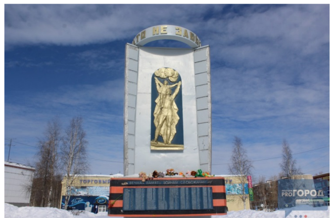
Обелиск воинам-слобожанам в Эжвинском районе