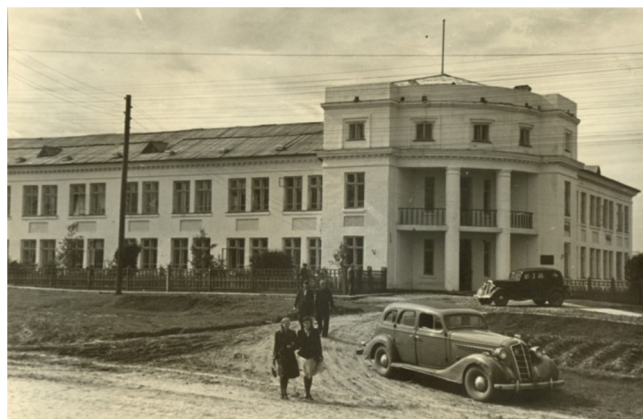
Главное здание Базы АН СССР на улице Коммунистической. 1946 год