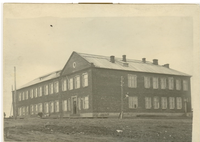
Школа № 16 на Совнаркомовской улице (ныне Лицей народной дипломатии) 1941 год

Постановлением Совета Народных Комиссаров СССР от 31 мая 1943 года было введено раздельное обучение мальчиков и девочек в неполных средних и средних школах столиц союзных и автономных республик, областных и краевых центров и крупных промышленных городов. 8 сентября 1943 года Совнарком РСФСР постановил ввести в будущем учебном году обязательное обучение детей семилетнего возраста.