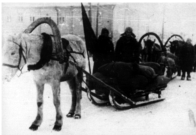
Сдача хлеба в фонд обороны в Тентюково

В связи с угрозой гибели урожая в сентябре 1941 года бюро обкома партии приняло постановление «О привлечении учащихся 5–10-х классов к уборке урожая в колхозах с отрывом от учебы». На основании постановления Совнаркома СССР и ЦК ВКП(б) «О порядке мобилизации на сельскохозяйственные работы в колхозы, совхозы и МТС трудоспособного сельского населения городов и сельских местностей» от 17 апреля 1942 года горисполком ежегодно проводил трудовую мобилизацию на сельскохозяйственную работу городского населения. Мобилизовывались мужчины от 14 до 50 лет, не работавшие на предприятиях промышленности и на транспорте, часть рабочих, служащих, учащиеся 6–10-х классов школ, студенты.