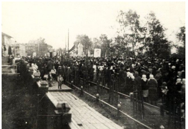
Общегородской митинг на улице Кирова в Сыктывкаре 22 июня 1941 года