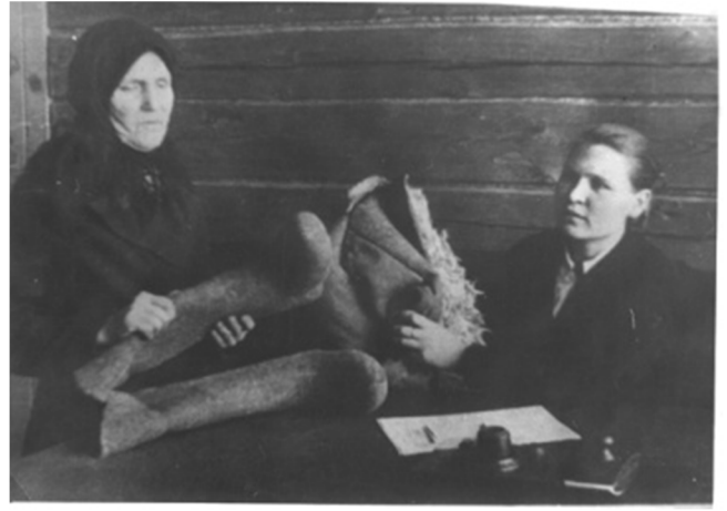
Сбор теплых вещей для Действующей армии