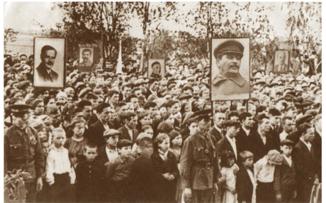
Общегородской митинг на улице Кирова в Сыктывкаре 22 июня 1941 года