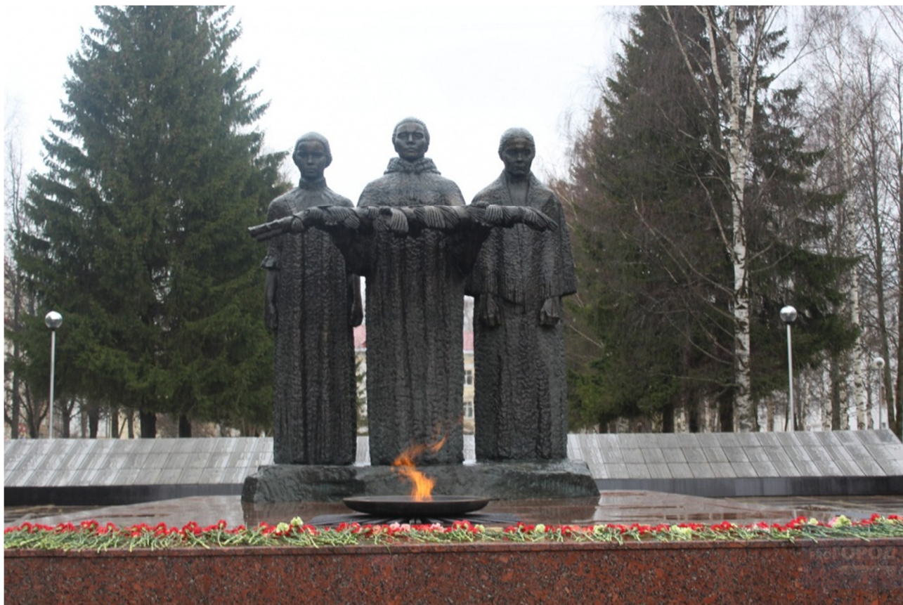
Мемориал «Вечная слава»