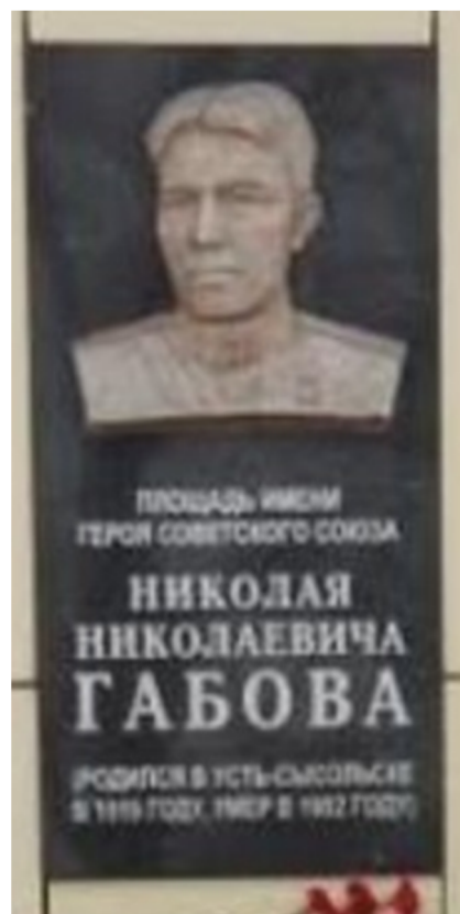
Мемориальная доска на площади имени Габова Н.Н. в Сыктывкаре