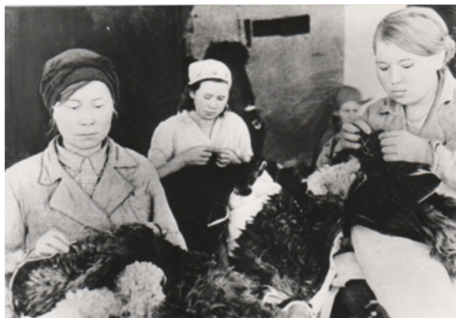
Пошив шуб для Действующей армии в артели «Швейник». 1943 год