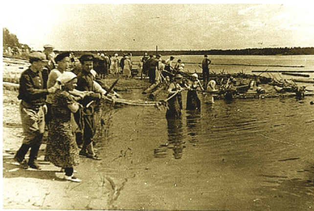
Субботник в Нижнем Чове. Июль 1941 года

Кормили нас, как рабочих, в сплавной столовой. Меню было незатейливое: суп (водичка с капустой), овсяная, перловая, иногда пшеничная каша с кружочком постного масла посредине, морковный чай без сахара (или с сахарином) или компот из сухофруктов, маленький ломтик черного хлеба. Порой с кашей давали рыбу. Иногда готовили кашу из муки. Те, кто сильно голодал, в выходной день специально приходили в Трехозерку из города, чтобы поесть – еда оставалась, поскольку рабочих в этот день было меньше. Из дому брали мы несколько вареных картофелин, либо пареной репы, но обычно по дороге все съедали. Сколько-то нам платили за работу...».