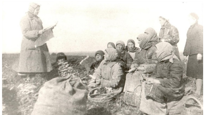
Агитатор сообщает колхозникам с Тентюково об освобождении Донбасса

Уже в 1942 году начался сбор средств и предметов первой необходимости в фонд помощи освобожденным районам СССР. Только учащиеся и учителя школ Сыктывкара к марту 1943 года внесли в этот фонд 67 700 рублей (облигациями и наличными деньгами), 1200 предметов одежды, около 200 тетрадей, 100 ручек и 300 томов художественной литературы. Трудящимся освобождённых районов Тульской области сыктывкарцы собрали и отправили 10523 штуки одежды, 712 пар обуви, 594 метра мануфактуры, 280 штук посуды, 17 464 учебных пособий и 8 вагонов пиломатериалов. Для восстановления животноводческих ферм районов Новгородской и Ленинградской областей колхозы Сыктывкара отправили 200 голов крупного рогатого скота и 100 свиней. Горожане помогали также населению города Ленинграда, Московской области, содействовали восстановлению приволжских речных портов, Южно-Донецкой железной дороги. В конце войны 40 молодых рабочих отправились на восстановление Сталинграда.