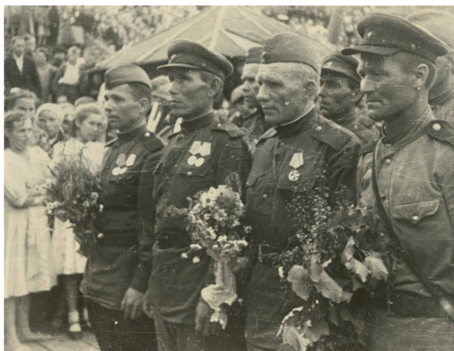
Встреча фронтовиков в Сыктывкаре

Напрасно дежурные пытались удержать людей, пробирающихся к дебаркадеру, чтобы скорее встретиться с родными, знакомыми, близкими. Все слилось воедино: песни, задорный смех молодежи, музыка духового оркестра.