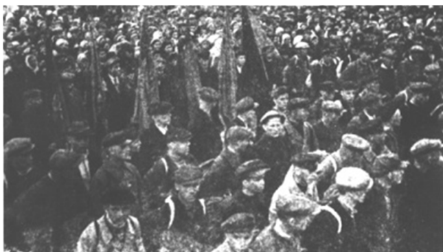
Митинг в Сыктывкаре перед отправкой на фронт. Июнь 1941 года

27 июня 1941 года из Сыктывкара отправлен на фронт первый маршевый батальон резервистов. В 1941–1942 годах из Сыктывкара на фронт было отправлено около восьми тысяч человек. Всего с июля 1941 года по май 1945 года в Сыктывкаре было призвано в армию 10 332 человека, в том числе 565 женщин.