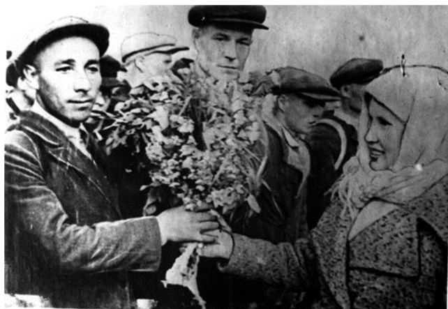
Проводы на фронт в Сыктывкаре. Июнь 1941 года

По общегражданским и партийно-комсомольским мобилизациям в годы войны было направлено на фронт 519 сыктывкарских коммунистов (из них 45 секретарей первичных парторганизаций) и 1098 комсомольцев, т.е. больше половины состава партийной и комсомольской организаций города.